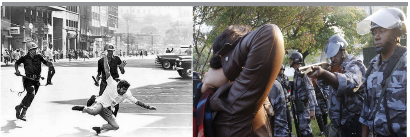
N.E: A foto da esquerda é o registro da repressão policial ao movimento estudantil na década de 60 e a da direita aos estudantes da USP no ano de 2011. Na ditadura ou no regime democrático burguês a violência policial-estatal é elemento fundamental para a dominação do capital.

É esta a raiz social da crescente criminalização e repressão que vive a sociedade brasileira, o que em nada é um paradoxo para com a Democracia burguesa. Ao contrário disso, é o modo de afirmá-la no atual estágio do capitalismo.